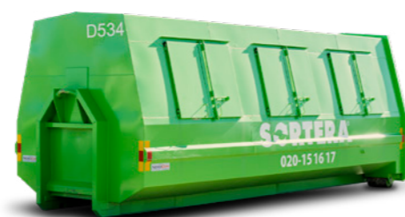
LASTVÄXLARE (STÄNGD) 25 M 3

Mått: B: 2,4 m / L: 4,5 m / H: 2,1 m Maxlast: 8 ton