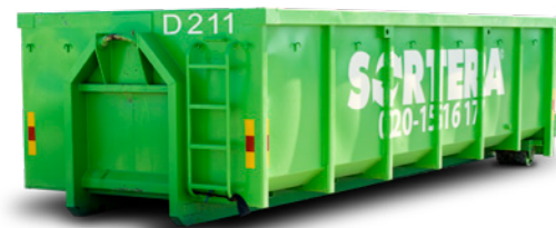
LASTVÄXLARE 18 M 3

Mått: B: 1,7 m / L: 4,0 m / H: 1,8 m Maxlast: 6 ton