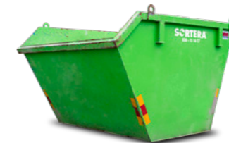
BM-FÄSTE 3 M 3

Mått: B: 2,4 m / L: 6,0 m / H: 2,4 m Maxlast: 8 ton