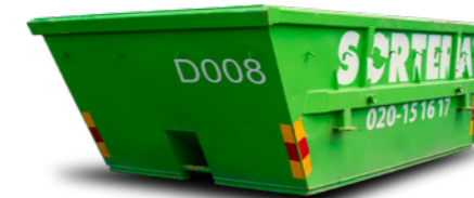
LIFTDUMPER 5 M 3

Mått: B: 2,4 m / L: 6,0 m / H: 1,1 m Maxlast: 8 ton