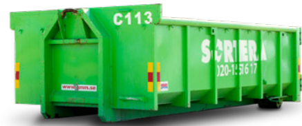
LASTVÄXLARE (KORT) 10 M 3

Mått: B: 2,4 m / L: 4,5 m / H: 1,3 m Maxlast: 8 ton