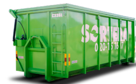
LASTVÄXLARE (LOCK) 30 M 3

Mått: B: 2,14 m / L: 1,72 m / H: 1,31 m Maxlast: N/A