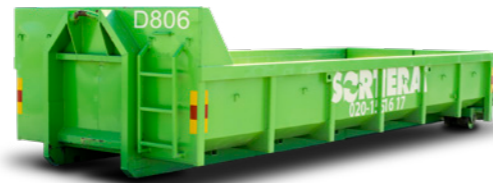
LASTVÄXLARE (LÅNG) 10 M 3

Mått: B: 2,4 m / L: 4,5 m / H: 1,3 m Maxlast: 8 ton