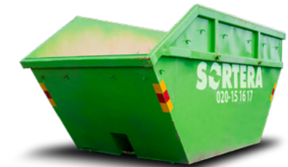
LIFTDUMPER 10 M 3

Mått: B: 1,9 m / L: 3,1 m / H: 1,1 m Maxlast: 6 ton