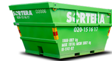
LYFT 8 M 3

Mått: B: 1,9 m / L: 3,7 m / H: 1,9 m Maxlast: 6 ton