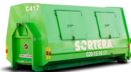
LASTVÄXLARE (STÄNGD) 15 M 3

Mått: B: 1,91 m / L: 3,7 m / H: 1,59 m Maxlast: 6 ton