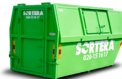
LIFTDUMPER (STÄNGD) 10 M 3

Mått: B: 2,4 m / L: 6,0 m / H: 2,3 m Maxlast: 8 ton