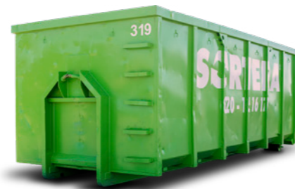
LASTVÄXLARE 30 M 3

Mått: B: 2,4 m / L: 6,0 m / H: 1,6 m Maxlast: 8 ton